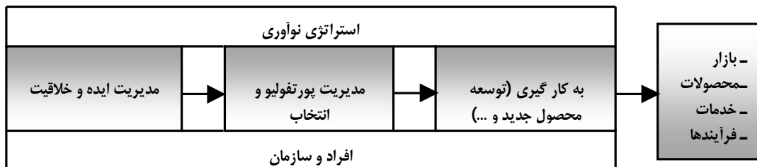
شکل شماره 3. مدل مدیریت نوآوری [9].

تحقیقات مختلف نشان داده اند که سازمان ها یک رویکرد ساختاریافته را جهت اجرای بهتر نوآوری در سازمان پذیرفته اند. البته یک رویکرد رسمی برای اجرای نوآوری، بتهنهایی موفقیت آن را تضمین نمی کند. در شکل شماره 3 یک مدل پنج مرحله ای برای مدیریت نوآوری نشان داده شده است.