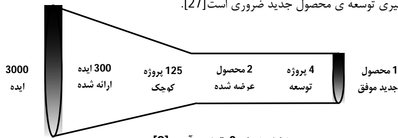
شکل شماره 2. قیف نوآوری [8].

البته باید توجه داشت که اغلب ایده های نوآورانه به محصولات یا خدمات جدید و موفق تبدیل نمی شوند. مطالعه ها نشان می دهد که حدود 3000 ایده خام لازم است تا یک محصول کاملاً جدید و از نظر تجاری موفق به وجود آید. بنابراین فرآیند نوآوری را اغلب به صورت یک قیف ترسیم می کنند [8]. کارکرد نظام پذیرش و بررسی پیشنهادها در گردآوری حجم وسیعی از ایده ها مشابه این قیف عمل می کند. از آن جا که نوآوری با تولید ایده های جدید شروع می شود، تولید ایده برای نوسازی و موفقیت شرکت ها بسیار مهم است [24]. بنابراین بررسی انبوهی از ایده ها و ارزیابی آن ها برای تصمیم گیری توسعه ی محصول جدید ضروری است [27].